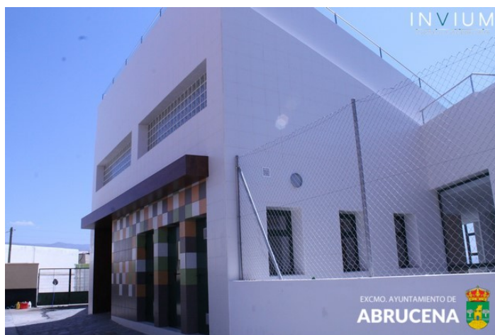
Vista lateral derecha de la entrada