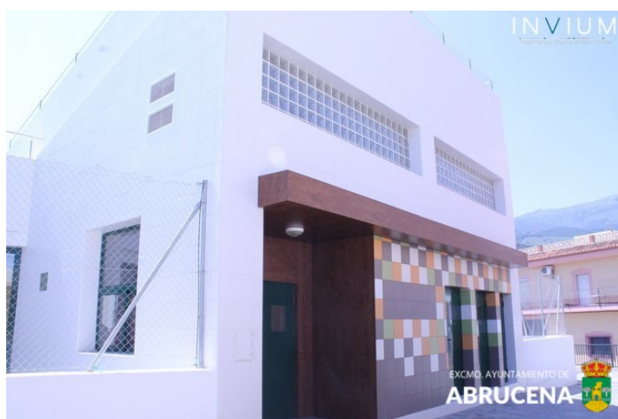
Vista lateral izquierda de la entrada