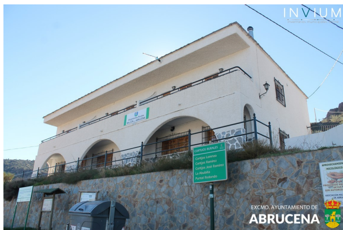
Fachada en Ángulo