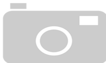
IMAGEN NO DISPONIBLE

Destino Funcional: Circulación de vehiculos y/o personas