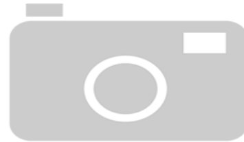
IMAGEN NO DISPONIBLE

Destino Funcional: Circulación de vehiculos y/o personas